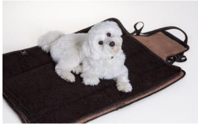
Die drei Größen des Hundebetts