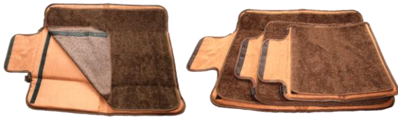
Das Teddyfutter ist abnehmbar